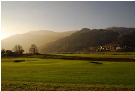
18-Loch Golfplatz Buna Vista Golf Sagogn

Wer sich verwöhnen lassen und sein Handicap auf tadellosem Grün in atemberaubender Natur verbessern möchte, bucht eines der attraktiven Golf-Packages des 5-Sterne Hotelresorts Waldhaus Flims Mountain Resort & Spa. Unvergessliche Spielerlebnisse auf dem Golfplatz Buna Vista Golf Sagogn – neu mit 18 Löchern – sowie ein exklusives Gourmet- und Wellnessprogramm sind garantiert.